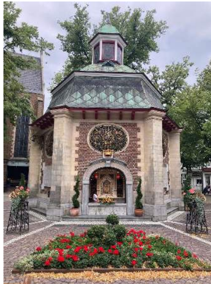
Foto: Gnadenkapelle in Kevelaer

Fahrt zum Schönstattzentrum Oermter Marienberg. Pilgerweg von der „Sonsbecker Schweiz“ nach Kevelaer zur „Trösterin der Betrübten“. Hl. Messe im Marienwallfahrtsort.