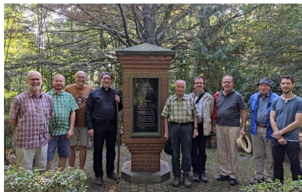
Gruppenfotos: vor dem Grab des seligen Karl Leisner in der Märtyrerkrypta des Xantener Domes (ganz oben); an der Karl-Leisner-Stele auf dem Oermter Marienberg (oben); die nicht namentlich gekennzeichneten Fotos stammen von Pfr. Christoph Scholten, Pfr. Jürgen Stahl und Diakon Holger Weikamp

Pfarrer Christoph Scholten Kirchplatz 1 47559 Kranenburg Tel.: 02826-226 E-Mail: Christoph.Scholten@web.de